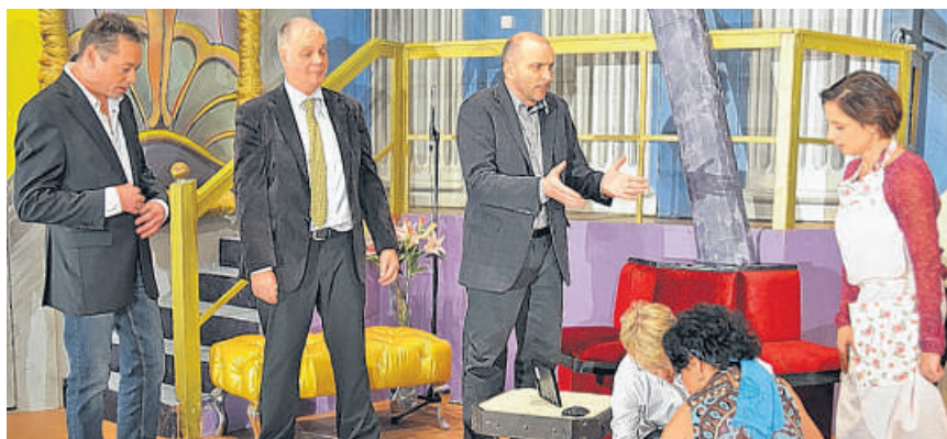
Theatergruppe Rampeliecht spielt mit viel Herzblut die Komödie «Haus in Aufruhr».

Dessen Protagonisten setzen stets, wenn das sorgfältig aufgebaute Lügengebäude um die erfundene Familie Meili einzustürzen droht, noch einen drauf, so dass die Zuschauer vor lauter Schwindeleien nicht mehr wissen, was wahr ist und was erfunden. Nächste Vorstellungen: Freitag, 29. November, und Samstag, 30. November, 20.00 Uhr. www.rampeliecht.ch .