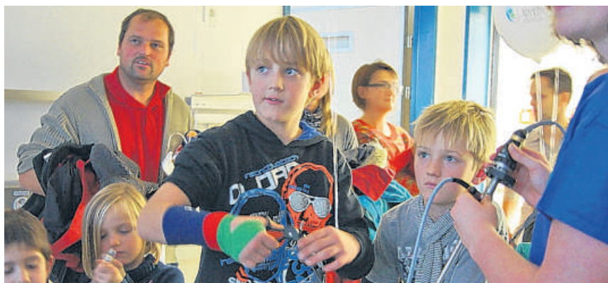
Im Spital Dornach ist ein Blick in den Operationssaal erlaubt.

anlegen (selbstverständlich an Puppen). Im Kantonsspital Olten findet am Freitag, 22. November abends eine Festveranstaltung statt, welche sich an ein breites Publikum richtet. Die Chirurgie des Bürgerspitals Solothurn lädt am Samstag, 23. November, 10 Uhr, zu Vorträgen mit Chirurgen in den Konzertsaal Solothurn ein. Beim Apéro beantworten sie Fragen.